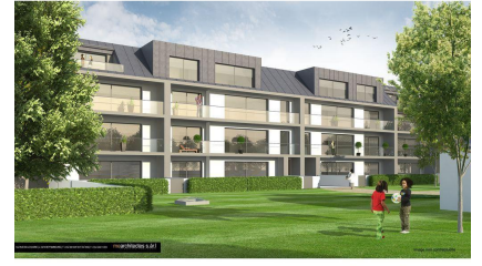
IMMOBILIÈRE ROMAIN THILL